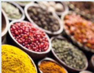
Ingredientes y materias primas