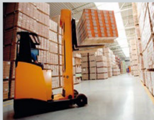
Logística y transporte