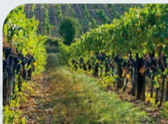
Agricultura y ganadería sustentable