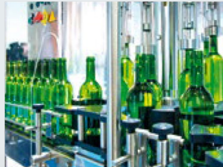
Procesamiento de alimentos y bebidas