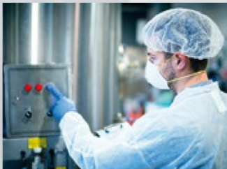
Seguridad y calidad alimentaria